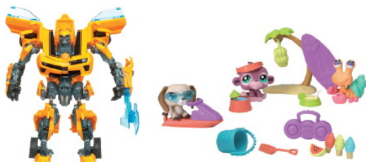
FIGURINES D'ACTION TRANSFORMERS - MINI UNIVERS LITTEST PET SHOP