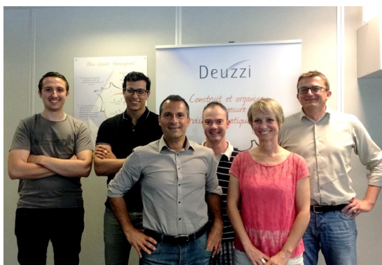
EQUIPE PAYS DE SAVOIE – ISÈRE

→ Effectif : 7 → Chiffre d'affaires : 4 400 000€ → Année de création : 2003