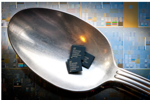
LA PUCE MISE AU POINT PAR BESPOON ET LE CEA LETI