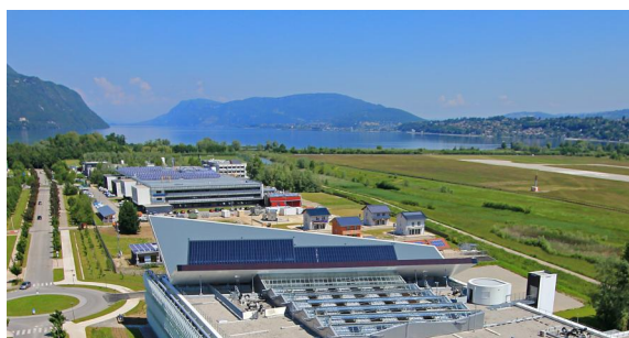
VUE AÉRIENNE DU SITE INES

→ Effectif : 450 → Chiffre d'affaires : NC → Année de création : 2005