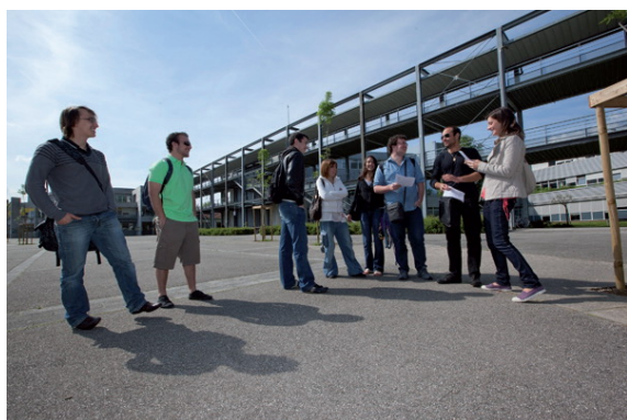
Des études de qualité dans un environnement privilégié

→ Effectif : 1260 → Chiffre d'affaires : NC → Année de création : 1979