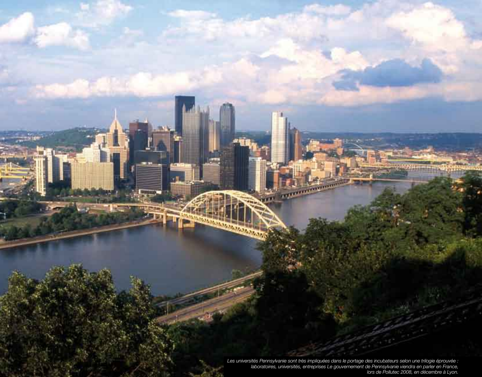
Les universités Pennsylvanie sont très impliquées dans le portage des incubateurs selon une trilogie éprouvée : laboratoires, universités, entreprises Le gouvernement de Pennsylvanie viendra en parler en France, lors de Pollutec 2008, en décembre à Lyon.

Savoie Technolac y répond évidemment, par une offre immobilière, financière, humaine. Ainsi, le métabolisme entrepreneurial produit doucement l'énergie de la success story.