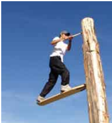
Pour ne pas scier en solo la branche de démarrage d'entreprise, le parcours aidé est le réflexe à préconiser.