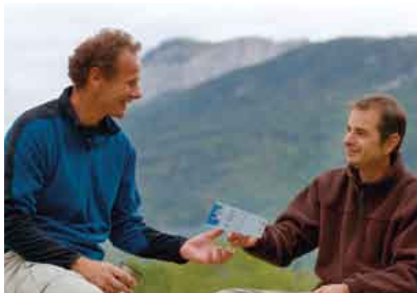
Les synergies des acteurs de l'accompagnement en Savoie offre au créateur un accueil adapté à son projet.