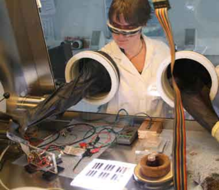
Le plan stratégique 2008 vise à rompre l'isolement féminin, à réaffirmer les compétences de la féminité sans positionnement stigmatisé résumant les femmes à des seules fonctions de service.