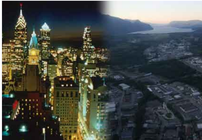
Savoie Technolac n'est pas très éloigné des solutions d'appui aux créateurs pratiquées aux Etats-Unis, à Philadelphie notamment.